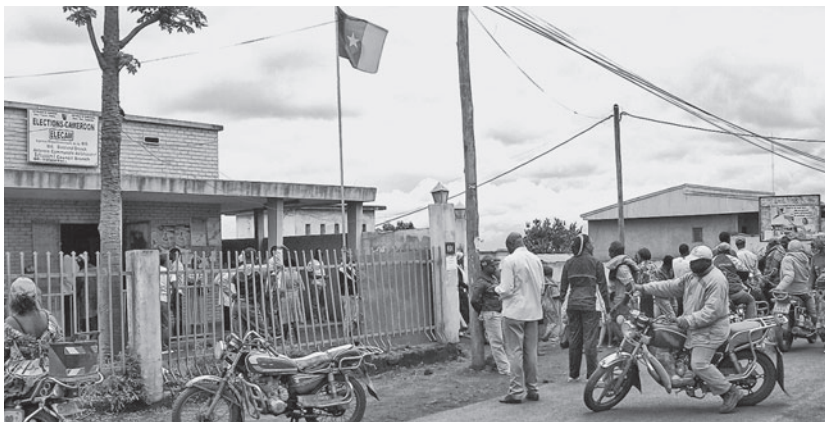
Des Citoyens devant le bureau d'Elecarn Bafoussam attendent d'être reçus